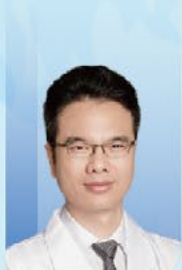
林天歆 教授 中山大学孙逸仙纪念医院