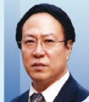
吴以岭 院士 中国工程院