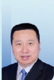
秦卫军 教授 空军军医大学西京医院