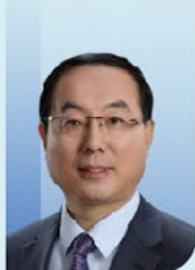
纪志刚 教授 中国医学科学院北京协和医院