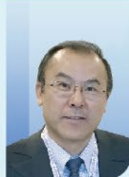
李建兴 教授 清华大学附属北京清华长庚医院