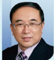
于金明 院士 中国工程院