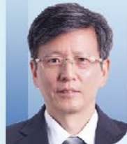
施剑林 院士 中国科学院