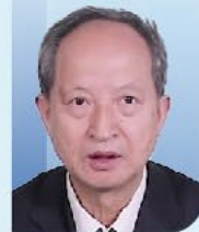
杨民 副会长 中国医师协会