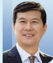
董家鸿 院士 中国工程院