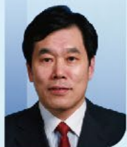
赫捷 院士 中国科学院