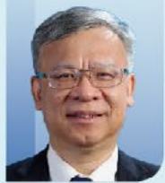
黄健 主任委员 中华医学会泌尿外科学分会